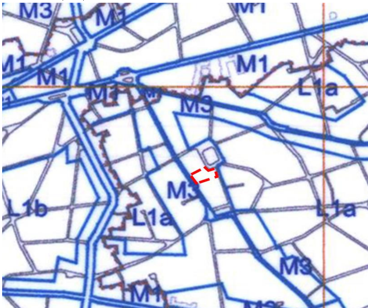
Extras din PUG Municipiul București, aprobat prin HCL 269/2000

Întrucât în Planul Urbanistic General al Municipiului Bucureștii aprobata prin HCL nr 269/2000 , biserica este încadrată în subzona M3 - subzonă mixtă cu clădiri având regim de construire continuu sau discontinuu și înălțimi maxime de P+4 niveluri.