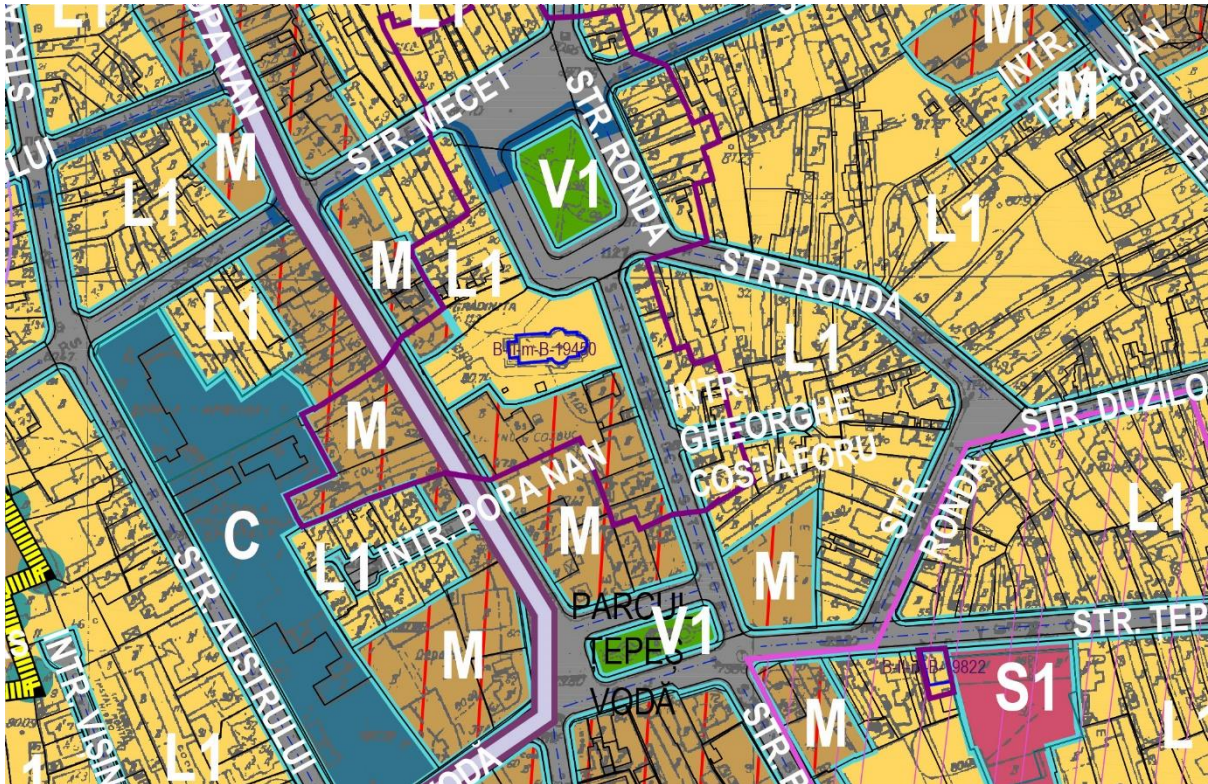
Extras din PUZ Sector 2, aflat in faza Informarea Populatiei, Faza a III-a

Avand in vedere cele prezentate mai sus, va aducem la cunostinta că reglementarile urbanistice finale se vor stabili în urma avizării proiectului P.U.Z. la instituțiile abilitate în acest sens, și dezbatute în cadrul Comisiei Tehnice de Circulații, Comisiei de Mediu, cat și a Comisiei Tehnice de Urbanism din cadrul Primăriei Municipiului București, ce sunt obligatorii în cadrul procedurii de avizare a Planului Urbanistic Zonal al Sectorului 2 al Municipiului București.